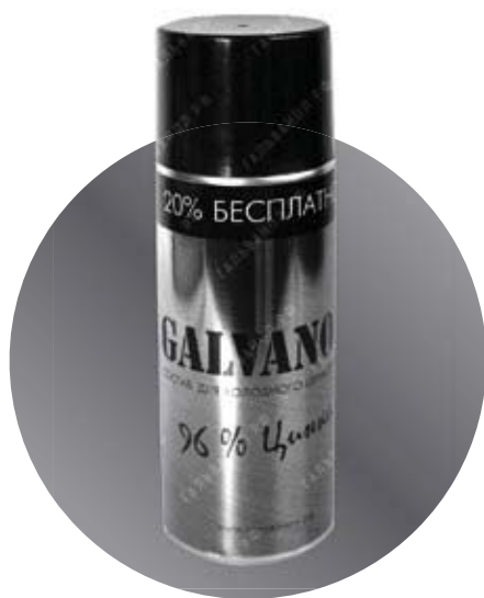
Баллон Объем: 520 мл