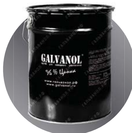
Банка Масса: 40 кг