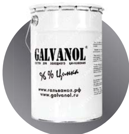
Банка Масса: 10 кг