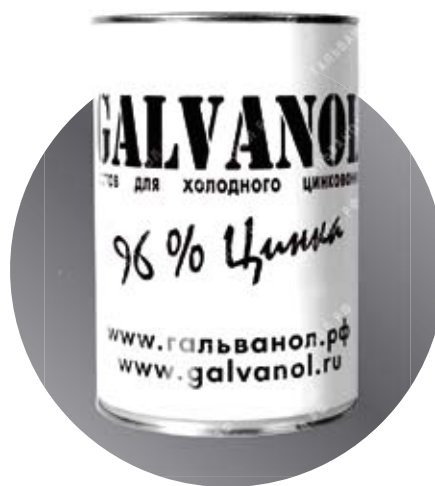
Банка Масса: 2 кг